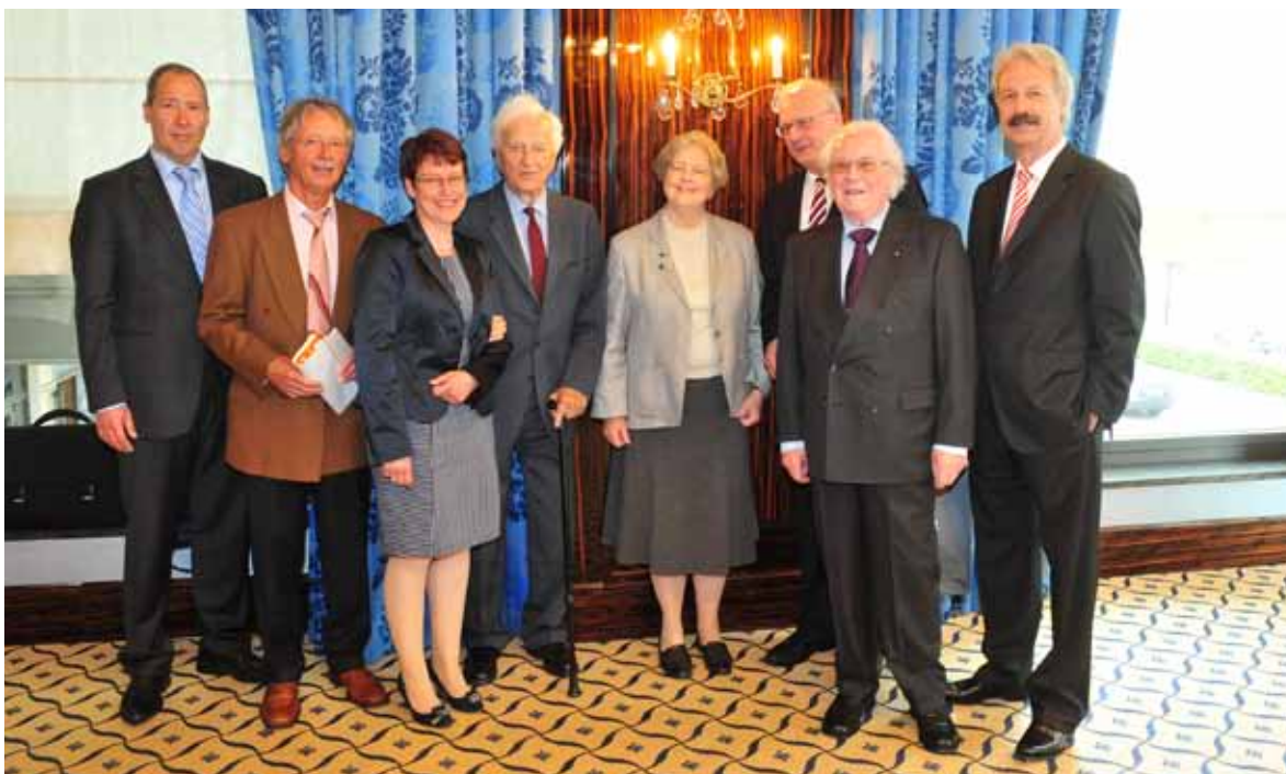
Der Vorstand mit Marianne von Weizsäcker und Bundespräsident a. D. Dr. Richard von Weizsäcker